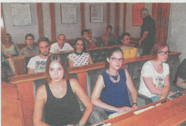
U početku su dolazili samo studenti iz Hrvatske, ali je škola prerasla u međunarodnu

- Moram pohvaliti Novi jer Grad uvijek koristi prigodu i pomaže manifestacije o Vinodolskom zakonu ili o Ivanu Mažuraniću i drugim svojim znamenitostima, zaključio je.