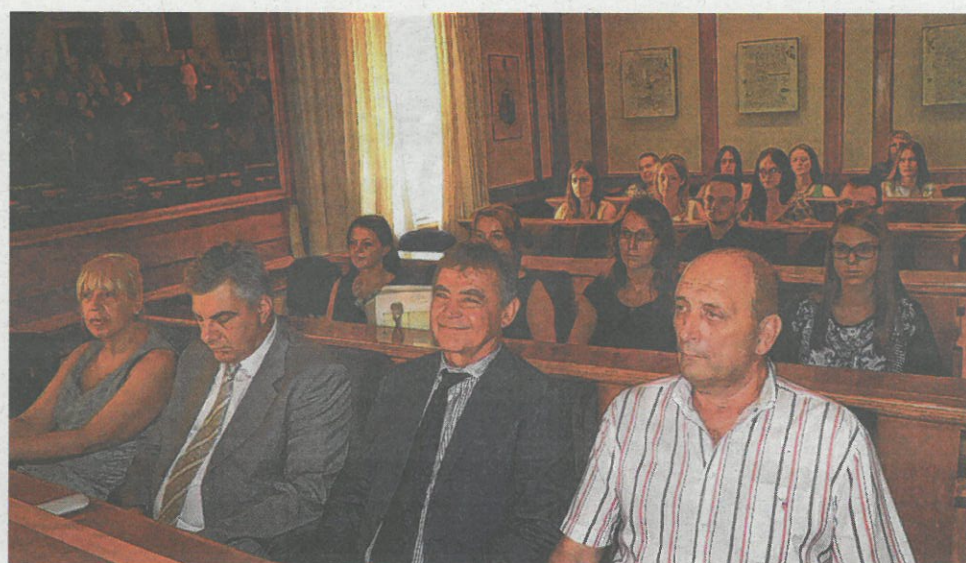
Veliku podršku organizatorima daju predstavnici Grada Novog Vinodolskog

TEORIJA I PRAKSA Počinje Ljetna škola ljudskih prava za studente u Novom Vinodolskom