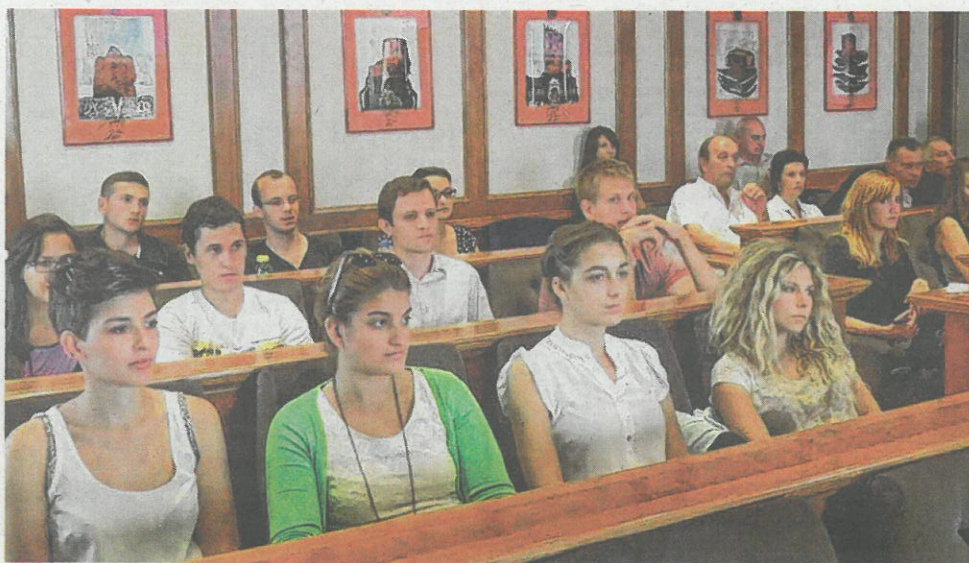
Studenti prava već dvanaest godina dolaze u Novi